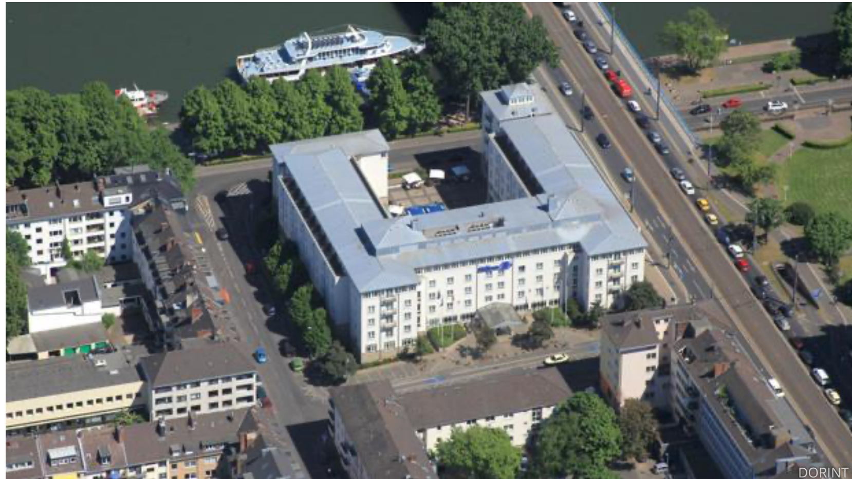
Das jetzige Hilton an der Kennedybrücke im Bonn aus der Vogelperspektive

Um 11 Uhr | Round Table Counter Place Ist der Urlaub trotz Inflation noch bezahlbar?